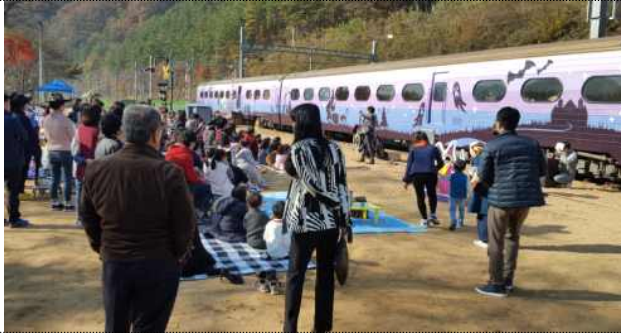
철도체험장 및 철도폐험장

“삼탄역 관광테마공원 조성”를 주제로 응모한 결과 선정되어 300백만원의 사업비를 확보하였고, 폐객차를 활용한 철도체험 및 마법관련 공간, 어린이 놀이체험장 공간을 조성하여 삼탄역을 찾는 관광객에게 다양한 볼거리 및 놀이거리 제공으로 지역활성화에 기여할 것으로 기대한다.