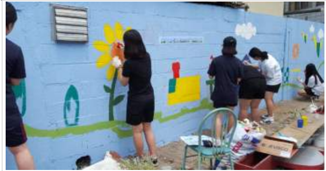
노후 골목길 개선