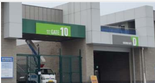
종합운동장 출입구 개선

충주시 종합운동장 개관과 함께 대규모 체육행사가 유치하여 추진하고 있으나, 행사장을 찾을 때마다 통일감 없이 복잡하게 설치된 정보안내체계로 한번에 목표지점에 찾기가 힘든 상황이며, 근무자들도 시민들 안내에 많은 시간을 소비하여 이 문제를 해결하기 위해 문화체육관광부의 “공공디자인으로 행복한 공간만들기” 공모사업에 「누구나 이용하기 쉽고 안전한 체육시설 안내사인 만들기」로 응모 선정되어 충주시 체육시설 정보안내체계 매뉴얼 및 시범사업을 2018~2019년에 추진하여 누구나 우리시 체육시설에 찾아오면 목적하는 곳에 쉽게 찾아갈 수 있는 정보안내체계를 개발하여 시민이 이해하기 쉽고, 특색이 있는 안전한 충주시 체육시설 구현에 기여하고자 한다.