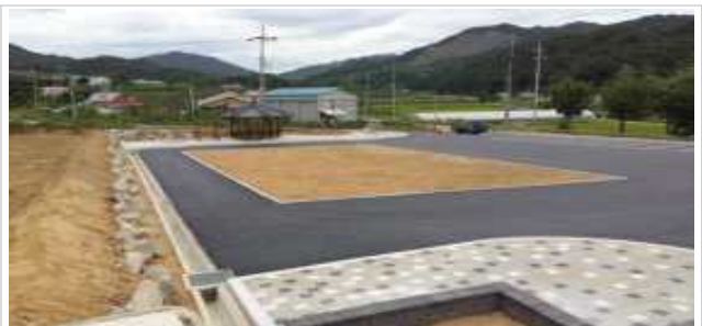
소태면 가정마을 다목적 광장 및 쉼터조성사업 後