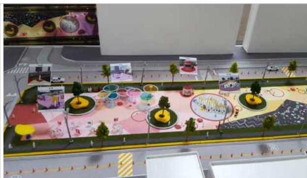
연수9호 어린이 공원