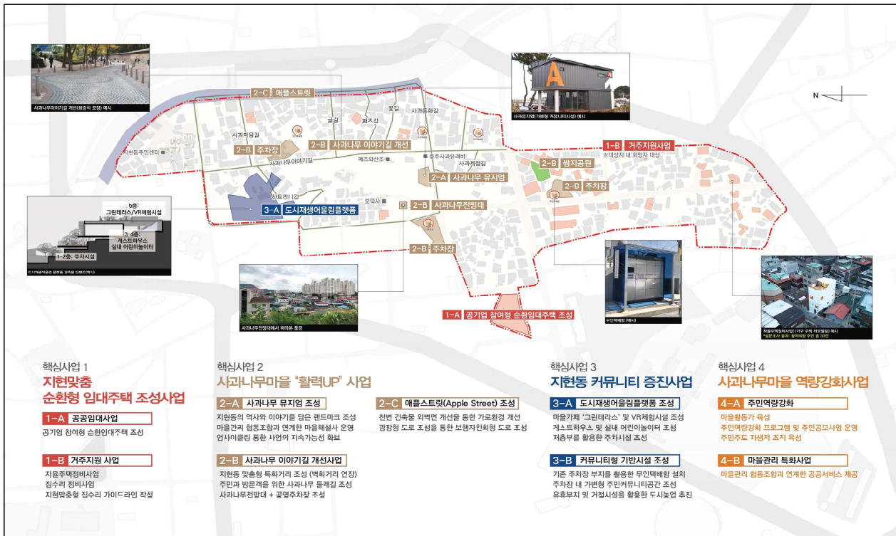
【지현동 도시재생 뉴딜사업 구상도】

향후 도시재생사업을 통하여 시민에게 여가생활 장소제공 및 창업을 통한 경제활동 기회제공과 방문객 증가로 인한 경제 활성화, 그리고 쾌적한 도심 환경 및 주차난 해소 등 다양한 도심지의 활성화 효과를 기대한다.