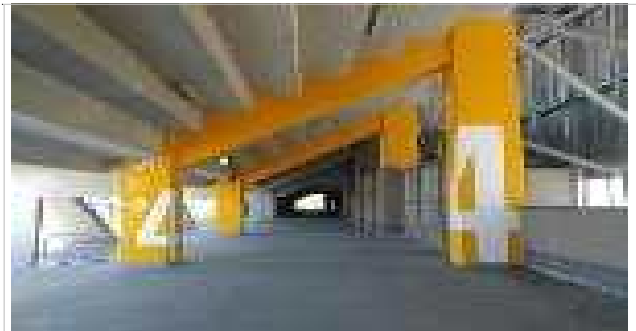
종합운동장 정보안내 사인