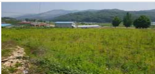
소태면 가정마을 다목적 광장 및 쉼터조성사업 前

2003년부터 추진해온 다목적광장 조성사업은 2018년에 소태면 가정마을에 2억 원을 투자하여 다목적광장 A=1,763m 2 를 조성하고 광장 내에 쉼터, 주차장, 체육시설, 조경시설 등을 설치하여 남녀노소 누구나 이용하여 건강증진 및 건전한 여가문화를 누릴 수 있게 하고 주민들이 화합하고 함께할 수 있는 장소 제공으로 주민들의 정주여건 개선에 이바지 하였다.