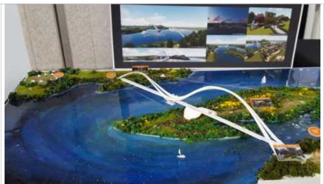
용섬 인도교 및 생태공원 조성