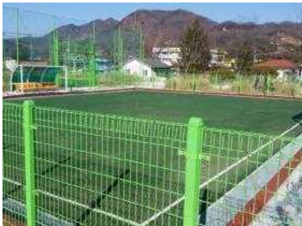
게이트볼장 및 다목적운동장