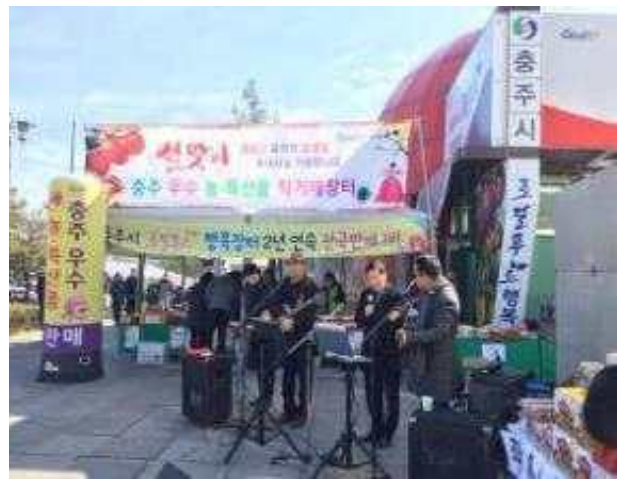
중부내륙고속도로 로컬푸드 행복장터