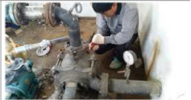
관정 및 양수장 보수