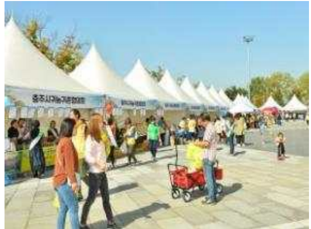
충주농산물 한마당 축제